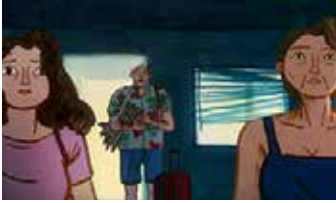
TRONA PINNACLES de Mathilde Parquet France

PRIX DES ACTIVITÉS SOCIALES DE L'ÉNERGIE LONGS MÉTRAGES EUROPÉENS Aide à la diffusion : 10 projections du film dans les centres de vacances des Activités sociales de l'énergie