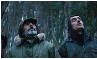
DIGGER de Georgis Grigorakis Grèce

PRIX DES ACTIVITÉS SOCIALES DE L'ÉNERGIE LONGS MÉTRAGES EUROPÉENS Aide à la diffusion : 10 projections du film dans les centres de vacances des Activités sociales de l'énergie