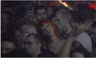
DUSTIN de Naïla Guiguet France

PRIX DES JEUNES CINÉPHILES COURTS MÉTRAGES FRANÇAIS 1 000€ offerts à la réalisatrice par l' Institut français