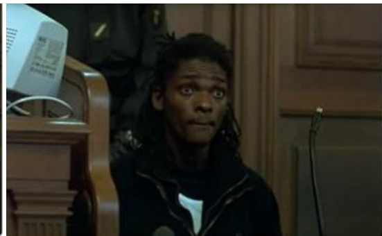
Réaction du prévenu à la demande de peine du réquisitoire.