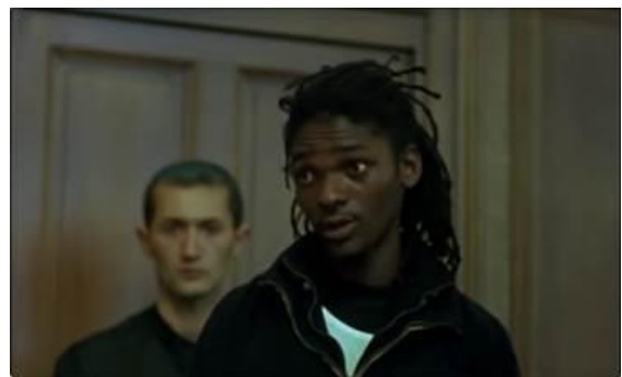
Le prévenu expose sa version des faits.