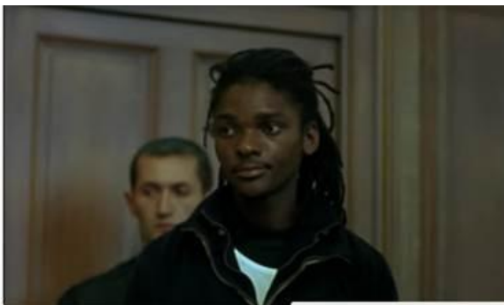
Le Prévenu écoute la présidente exposer les faits

« Je suis arrivé un peu tard sur Paris pour faire 380 euros ; j pense pas que j'aurais eu le temps de les faire » qui semble dire qu'il vend encore, contrairement à ce qu'il vient d'affirmer, à moins qu'il ait voulu dire qu'arrivé trop tard à Paris, il n'a pas pu aller déposer son mandat de 380 euros ? ) : cette parole semble visiblement peu crédible aux yeux de la juge .