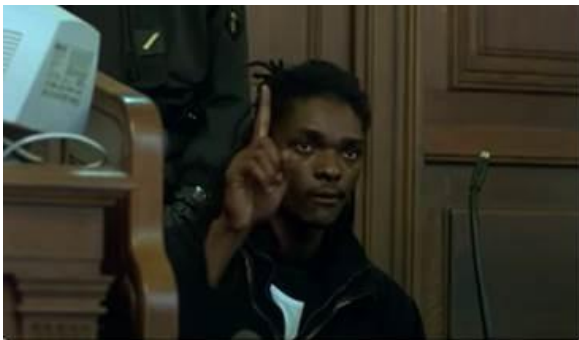
Prévenu levant la main pour prendre la parole et se faisant fermement « remettre » à sa place.

Son attitude évolue progressivement : il se désoriente et prend conscience de la gravité de la situation, notamment lors du réquisitoire (cf, le champ-contrechamp sur le personnage, visiblement surpris et choqué, au moment de la peine demandée de 15 mois d'emprisonnement). Son langage non verbal, sa posture et son regard traduisent une véritable décomposition émotionnelle.