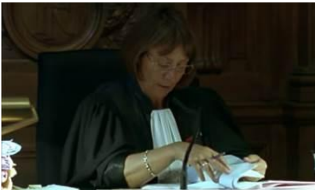
La présidente lit le dossier en échangeant avec le prévenu.