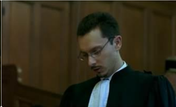
L'avocat lisant ses notes