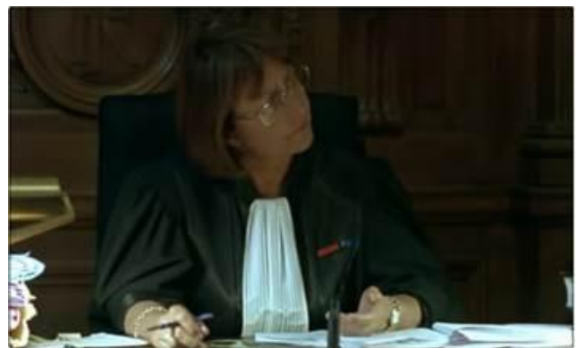
Echange avec le prévenu