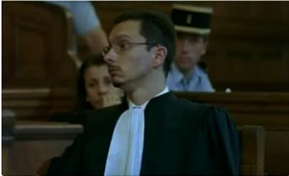
L'avocat écoutant et réagissant au réquisitoire