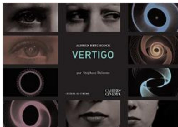
Dossier pédagogique du CNC

54 rue Beaubourg 75003 Paris – France Tel. +33 (0)1 42 71 53 70