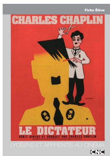
Fiche élève du CNC