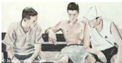
CHIEN DE LA CASSE de Jean-Baptiste Durand

La compétition des lectures de scénarios de longs métrages , en partenariat avec la Sacd et la Fondation VISIO , aura également lieu pendant la partie estivale de Premiers Plans, du 23 au 29 août . Voici les 3 projets sélectionnés :