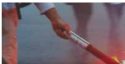
FAIRE FEU de Lucas Gloppe