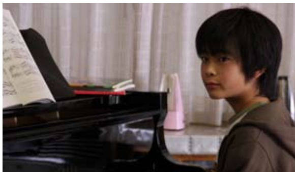
Tokyo Sonata de Kiyoshi Kurosawa

Mercredi 23 janvier -14h15 - Centre de Congrès