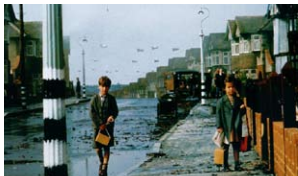
Hope and Glory de John Boorman