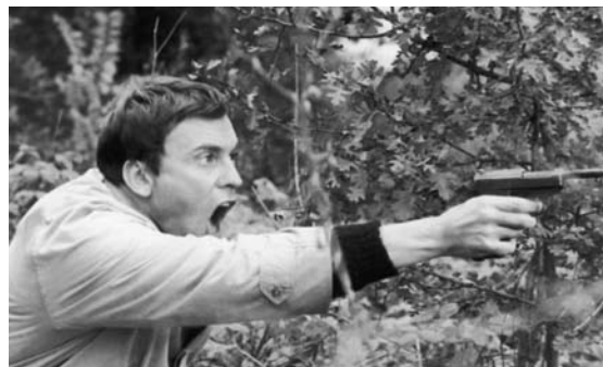
Le Combat dans l'île de Alain Cavalier