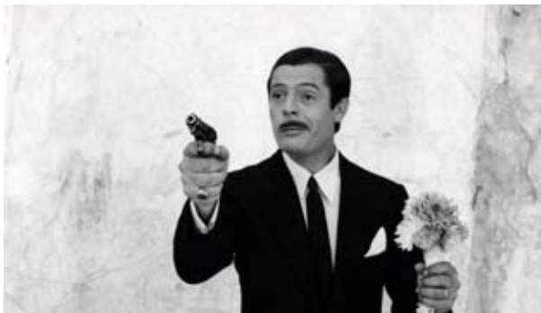
Divorce à l'italienne de Pietro Germi

Programmation en cours, liste sous réserve de modification