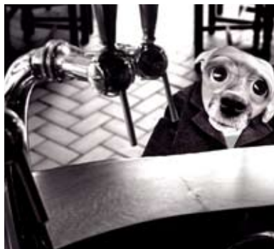
Peau de chien de Nicolas Jacquet