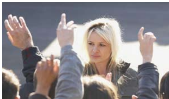
It's a Free World de Ken Loach