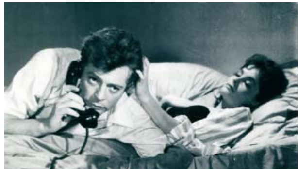
La Dolce Vita de Federico Fellini