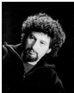
Radu MIHAILEANU