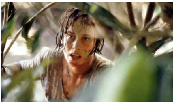
Rangoon de John Boorman