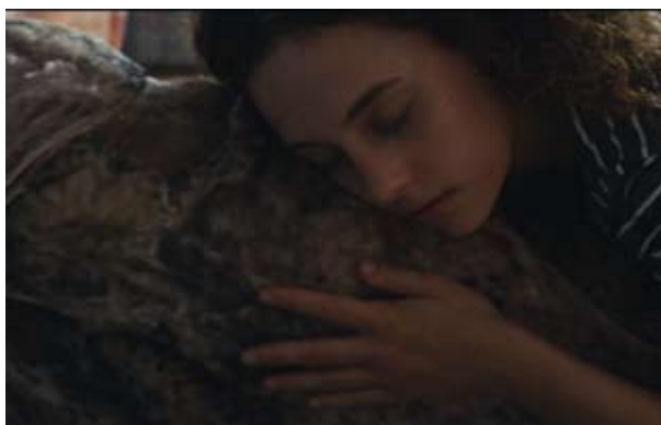
Zoo de Nicolas Pleskof