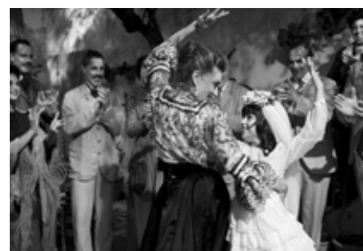
Blancanieves de Pablo Berger

Wadjda Haifaa Al Mansour Arabie Saoudite 97'