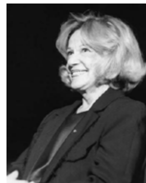
Jeanne MOREAU