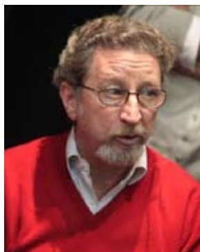
Robert GUÉDIGUIAN