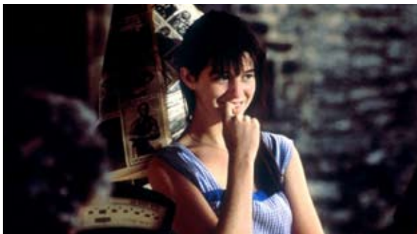
La Petite Voleuse de Claude Miller