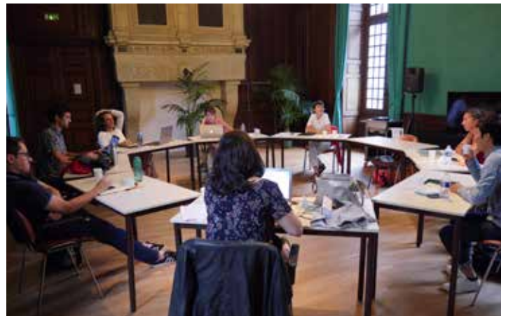
Entretiens individuels et collectifs / One-to-one meetings and collective reports