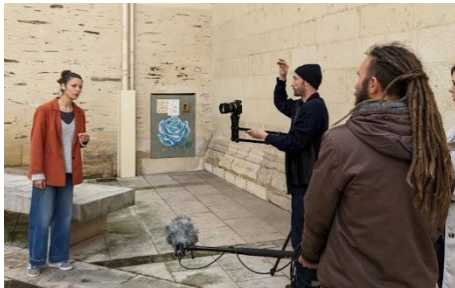
Formation régionale 2023