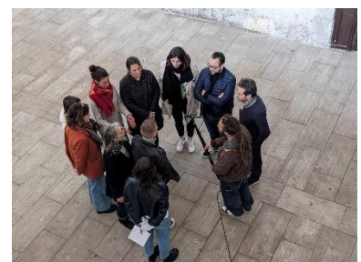
Formation régionale 2023