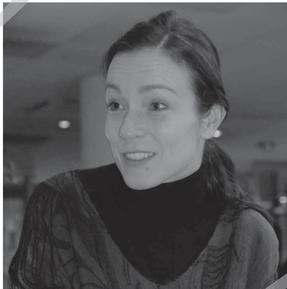
« Mes modèles sont Cate Blanchett et Kate Winslet ! »

Cette année, Stefania Rocca a été choisie pour intégrer le jury longs-métrages à Premiers Plans. Lorsqu'on l'interroge sur son rôle de juré, elle concède se fier à ses souvenirs : « le meilleur film étant celui dont on se souvient le plus, celui qui a eu le plus d'impact sur ta personne ». Ses précédentes expériences comme membre d'un jury (festivals de Locarno, Venise et Buenos Aires) lui ont appris