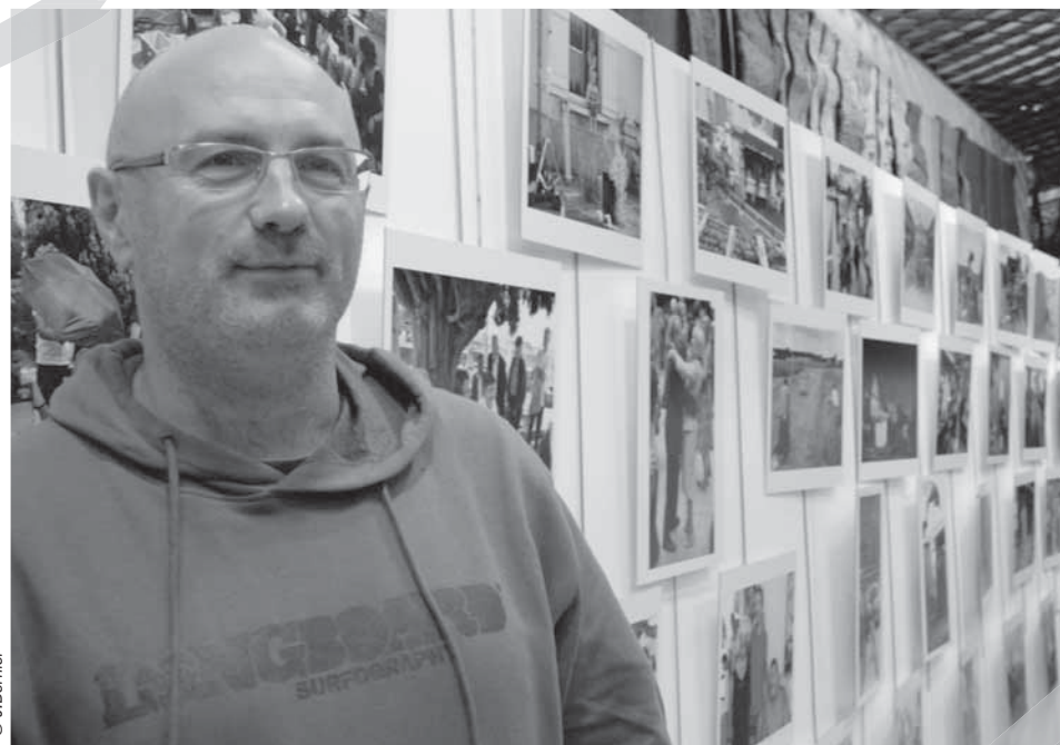
Jean-Michel Delage expose ses photos du tournage du film « Les petits ruisseaux » au Centre de congrès