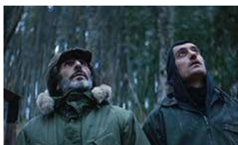
DIGGER de Georgis Grigorakis Grèce

PRIX DES ACTIVITÉS SOCIALES DE L'ÉNERGIE LONGS MÉTRAGES EUROPÉENS