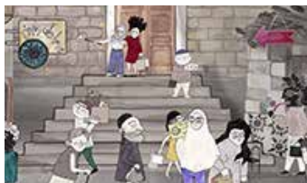
MOSAIC de Imge et Sine Özbilge Belgique

GRAND PRIX DU JURY COURTS MÉTRAGES FRANÇAIS 1 000€ offerts à la réalisatrice par le Conseil Régional des Pays de la Loire