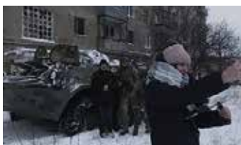
THE EARTH IS BLUE AS AN ORANGE de Iryna Tsilyk Ukraine / Lituanie

GRAND PRIX DU JURY DIAGONALES 1 500€ offerts à la réalisatrice par MUBI