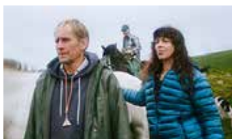
STAYING de Zillah Bowes Royaume-Uni

GRAND PRIX DU JURY COURTS MÉTRAGES EUROPÉENS 1 000€ offerts à la réalisatrice par le Crédit Mutuel Anjou , qui accompagne le Festival pour la promotion de ce film tout au long de l'année