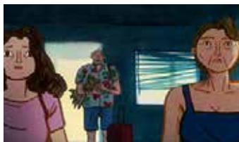
TRONA PINNACLES de Mathilde Parquet France

GRAND PRIX DU JURY COURTS MÉTRAGES EUROPÉENS 1 000€ offerts à la réalisatrice par le Crédit Mutuel Anjou , qui accompagne le Festival pour la promotion de ce film tout au long de l'année